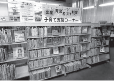
10月7日「子育て支援コーナー」を新設しました

出産、育児、名付け、料理…子育てに関する図書・雑誌をとり揃えたコーナーです。どうぞ活用下さい。