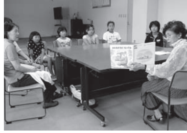
9月13日「子どもがお話をきく会」の様子です

出産、育児、名付け、料理…子育てに関する図書・雑誌をとり揃えたコーナーです。どうぞ活用下さい。