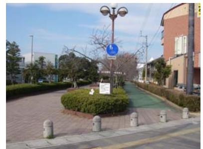
自転車歩行者専用道路

道路などの生活基盤施設の整備改善を進め、子どもや高齢者、障がい者など、誰もが安全で快適に暮らせる都市づくりを目指します。