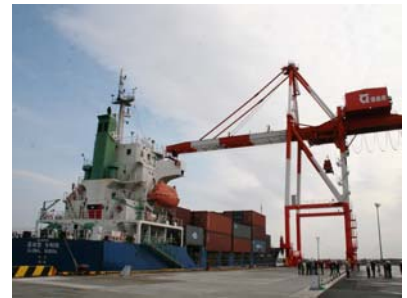
徳島小松島港コンテナターミナル (赤石地区)

市民生活の安定と向上を図るため、産業構造の変化に対応した土地利用の規制・誘導や都市施設整備を進め、活力ある地域産業を育む都市づくりを目指します。