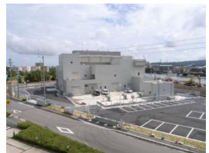
小松島雨水ポンプ場

自然災害から市民の生命と財産を守るため、ハード・ソフト施策の両面から防災・減災対策を進めるとともに、自助・共助・公助による協働の取り組みを強化し、災害に強く安心して暮らせる都市づくりを目指します。