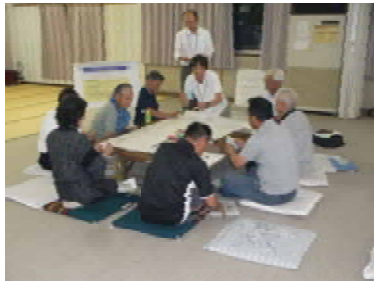
写真：（参加者どうしの意見交換）